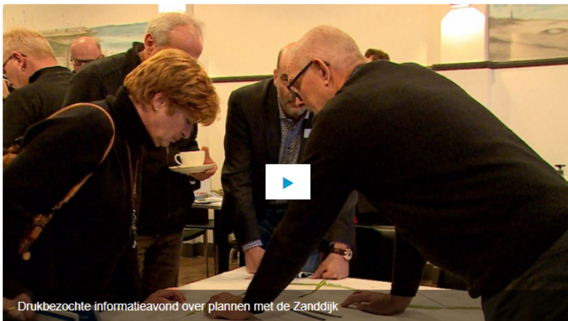
Drukbezochte informatieavond over plannen met de Zanddijk

In Yerseke lijkt weinig enthousiasme te zijn voor de plannen om de doorgaande wegen aan te pakken. De provincie heeft een keuze gemaakt voor 1 van de 4 onderzochte varianten: de Zanddijk verbreden, een viaduct over het spoor en een nieuwe rotonde.